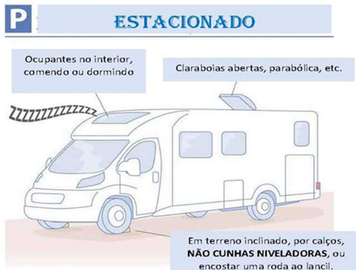
Fig. 1 Se estiver nestas condições, a autocaravana está estacionada e obedece unicamente às regras de trânsito, seja de dia ou de noite.